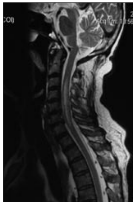
Obr. 1. T2 vážený MR obraz boreliovej myelitídy v období rozvinutej klinickej symptomatiky u pacienta 1.